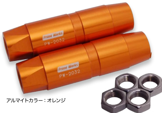
アルマイトカラー：オレンジ

鉄板を丸めてネジを切っただけのノーマルスリーブから、このジュラルミン削り出しのスリーブに交換することにより、ステアリング剛性を上げることができます。これら3種類でほとんどのGM車をカバーします。アルマイトのカラーは各4色。ジュラルミン A2017 Made in Japan