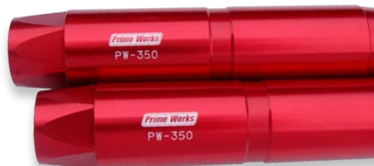
アルマイトカラー：レッド