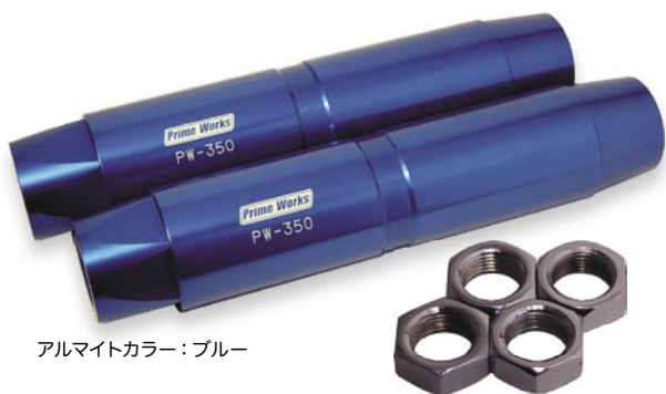
アルマイトカラー：ブルー