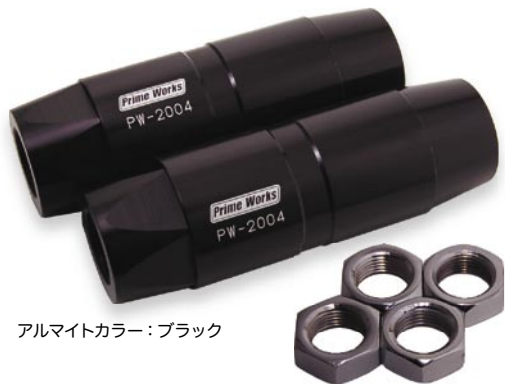
アルマイトカラー：ブラック