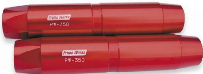
アルマイトカラー：レッド