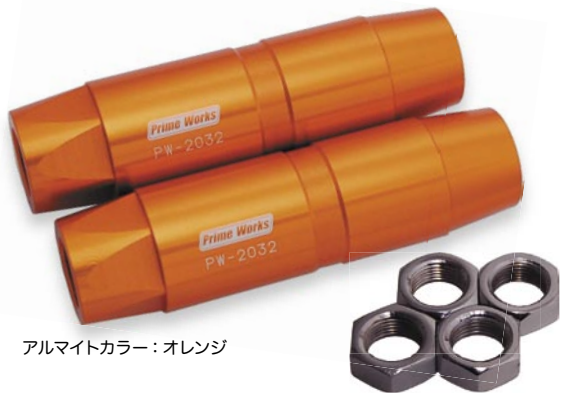
アルマイトカラー：オレンジ

鉄板を丸めてネジを切っただけのノーマルスリーブから、このジュラルミン削り出しのスリーブに交換することにより、ステアリング剛性を上げることができます。これら3種類でほとんどのGM車をカバーします。アルマイトのカラーは各4色。ジュラルミン A2017 Made in Japan