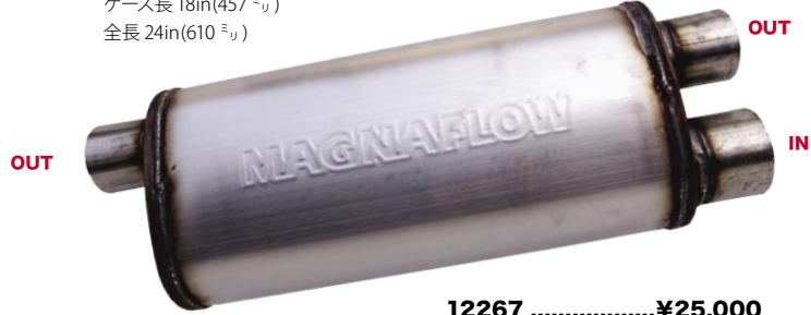
12267 ..... ¥25,000

カマロ・ファイアーバード用 (12267) OUT:2.5"x2 IN:3" リバーシブル不可 ケース長 18in(457 ± ) 全長 24in(610 ± )