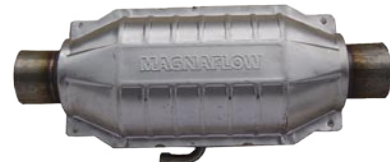
AIR Tube 付 94015, 94019