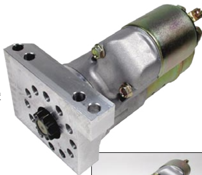
PSL100 マルチボルトホール

軽量 Pro-Racing Starter PSL-100 圧縮比 11.5:1 まで OK。ソレノイドの位置をボルトホールの数だけ変更出来ます。小型だがパワー、作動音、信頼性良好。スモール/ビッグブロックシボレー用。153丁/168丁リングギヤ、どちらにも対応。取り付けボルトに ARP 社製クロモリボルトが付属。