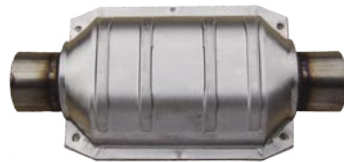
汎用触媒 91005, 91006, 94109